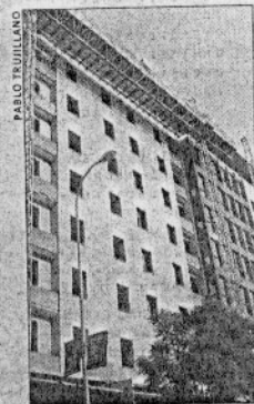
EN SEVILLA , los precios más caros siguen registrándose en la capital.

A nivel nacional, las tres capitales de provincia con el precio medio de la vivienda más elevado son Barcelona, Madrid y San Sebastián, mientras que Badajoz, Ourense y Lugo cuentan con el precio más bajo.