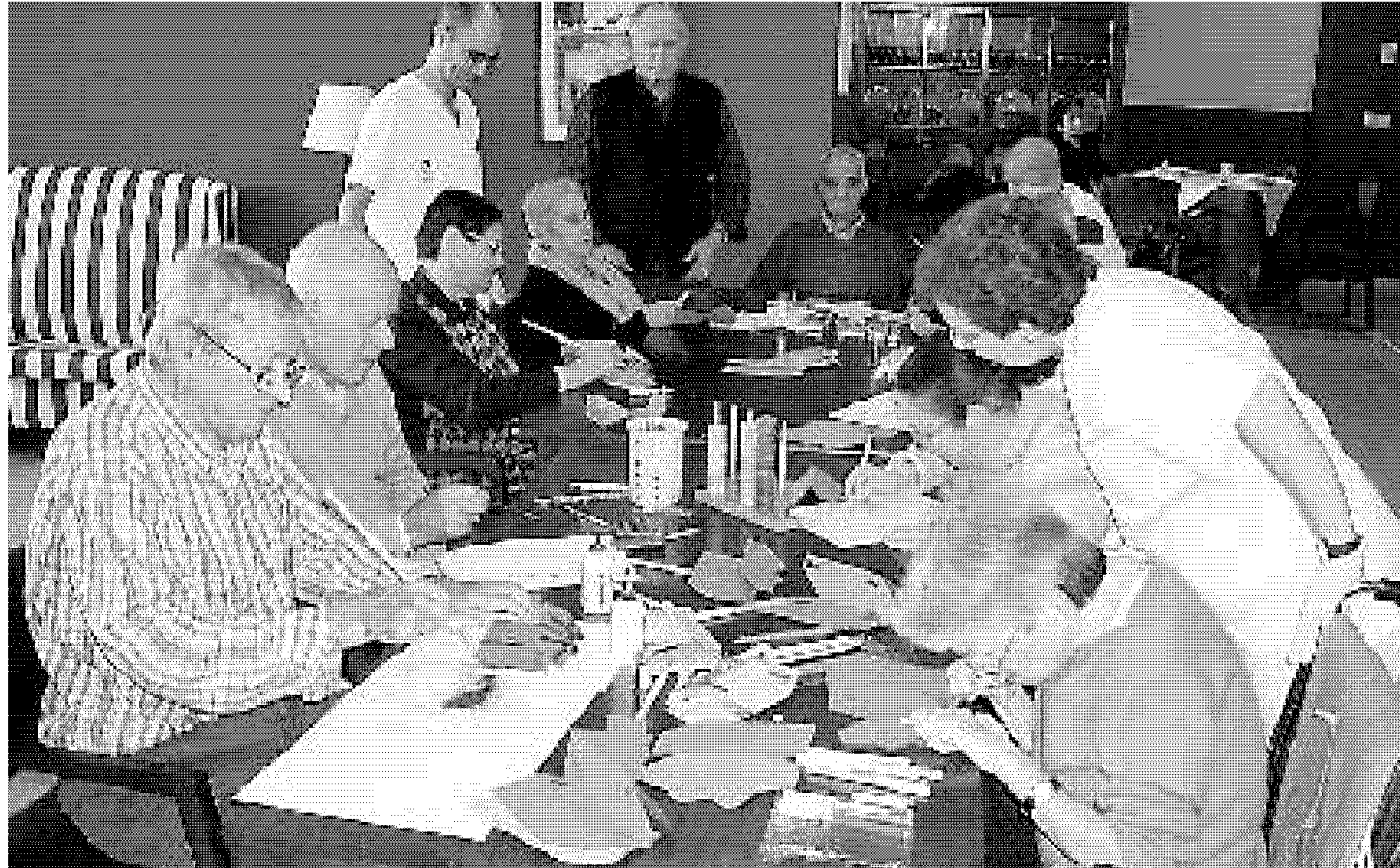
TAREAS. Los mayores de la residencia Sar Torrequebrada, durante la realización de los trabajos.