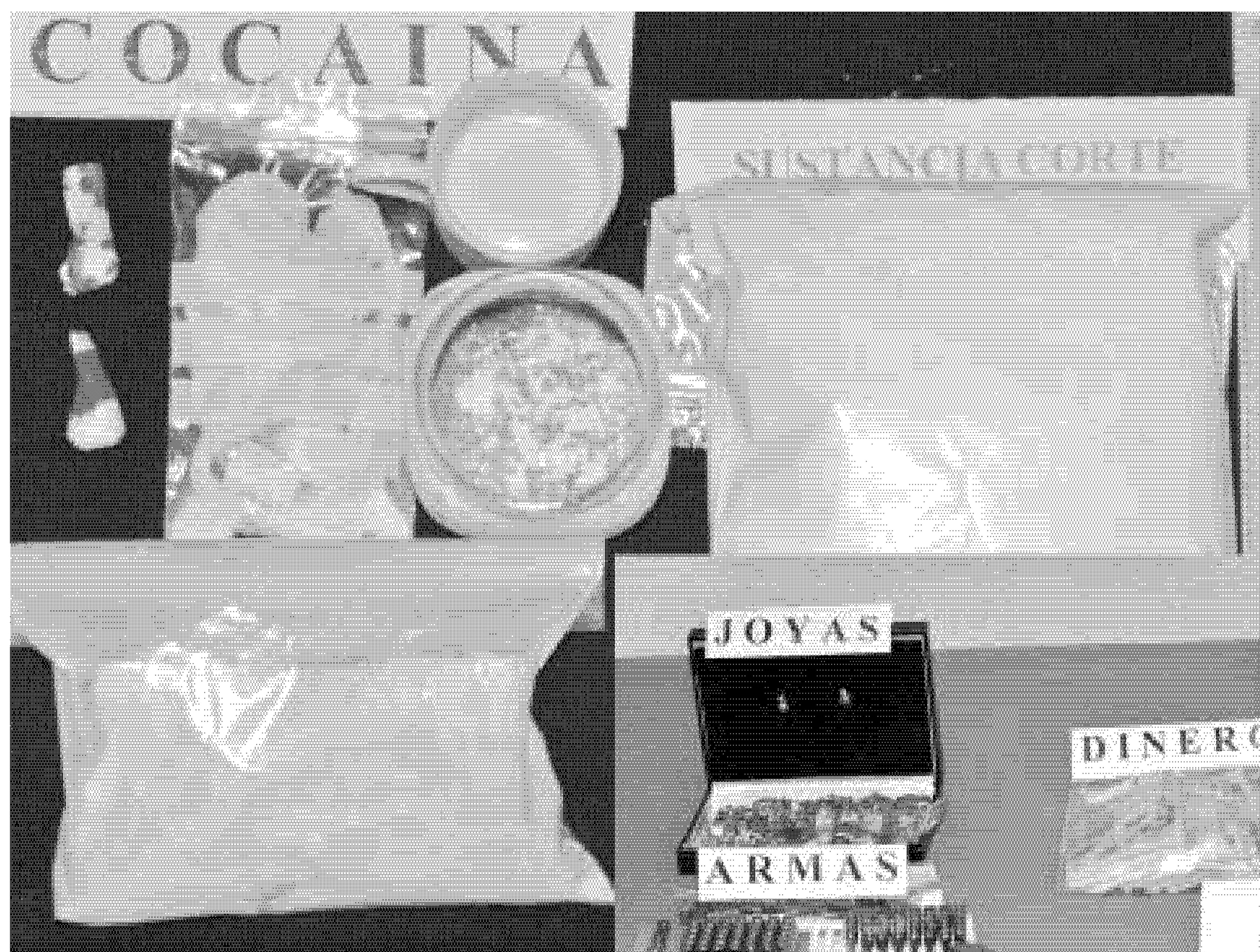
Material que fue incautado a la red que distribuía droga en el Guadiato.

El valor de la cocaína incautada rozaría los 100.000 euros