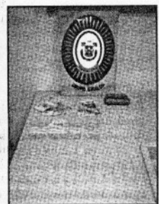
Parte del alijo incautado por el Grupo Giralda de la Policía Local.

Los agentes, pertenecientes al Grupo Giralda, acudieron a primeras horas de ayer a la ca-